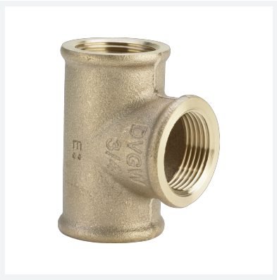
Té - taraudage Rp modèle 3130 article 264 420