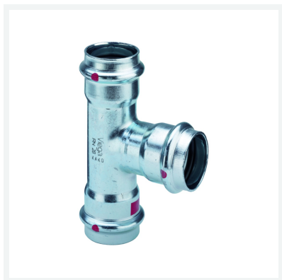
Té Prestabo avec SC-Contur modèle 1118 article 558 642