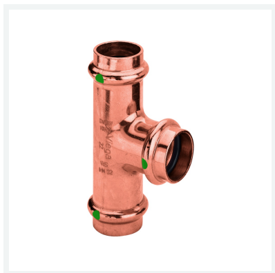
Té Profipress avec SC-Contur modèle 2418 article 307 899