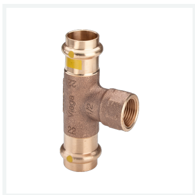
Té Profipress G modèle 2617.2 article 352 745