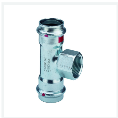
Té Prestabo modèle 1117.2 article 558 918