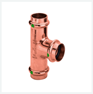
Té Profipress avec SC-Contur modèle 2418 article 291 952