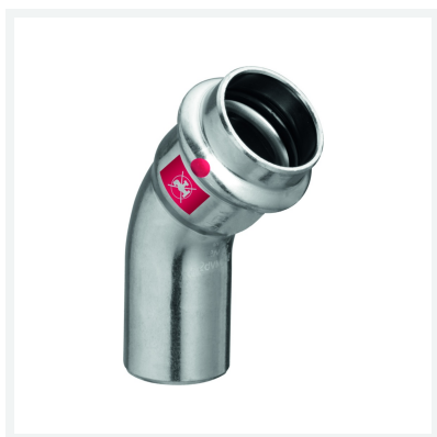
Coude 45° Prestabo modèle 1126.1 article 558 383