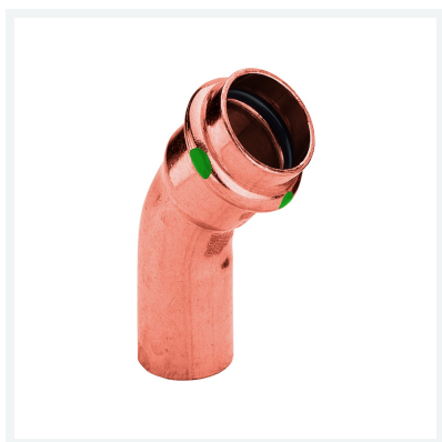
Coude 45° Profipress modèle 2426.1 article 292 515